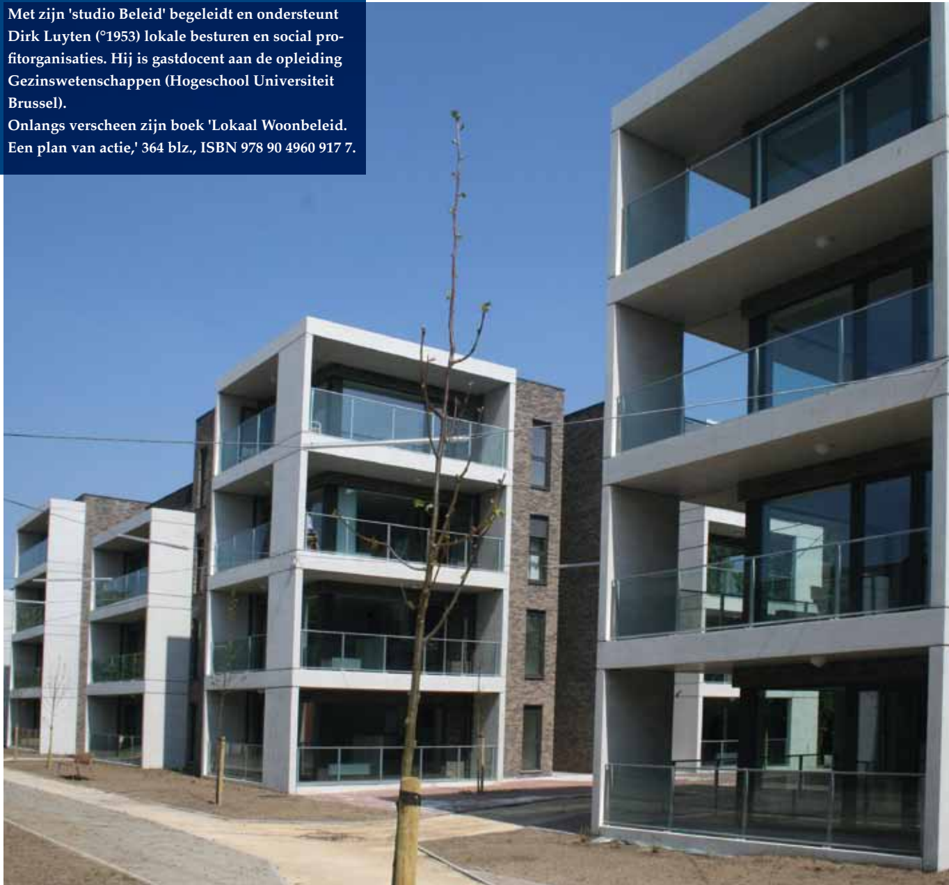
Serviceflats van het OCMW van Schoten.

Onlangs verscheen zijn boek 'Lokaal Woonbeleid. Een plan van actie,' 364 blz., ISBN 978 90 4960 917 7.