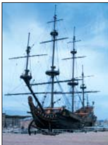
▲ De Prins Willem.

schepen restaureert. Op stapafstand bevindt zich ook het Marinemuseum. Dat wordt door de marine beheerd, een combinatieticket bestaat helaas niet. Nederlanders komen hier veel te weten over de heldendaden van hun zeelui, vooral tijdens de Tweede Wereldoorlog. Buitenlanders spreekt dit minder aan, maar dat wordt ruimschoots goedge maakt door de drie echte oorlogsschepen die hier naast het museum een vaste stek kregen. De mijnenveger Abraham Crijnssen (1936) en het ramschip Schorpioen (1868) liggen te water, maar