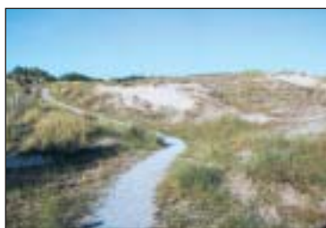
▲ Wandelpad in de duinen.

dat het VVV-kantoor er onderdak krijgt. Een van de ateliers is al ingenomen door een groepering die historische