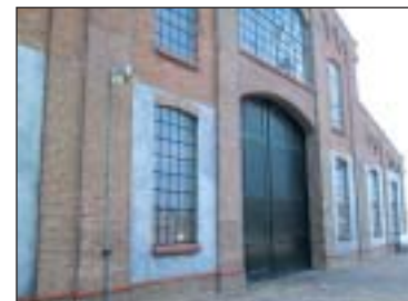
▲ Historische tocht door Cape Holland.

deeltelijk in nieuwbouw. Het is een kind- en gehandicaptenvriendelijk complex, met realistische simulaties. Tijdens de tocht met de vaarsimulator vertoef je echt in een storm op zee. Wie gauw zeeziek wordt laat dit onderdeel liever links liggen. Elders kunnen de kinderen klimmen of op schattenjacht gaan. Het pronkstuk van het themapark is de Prins Willem, een vrij nauwkeurige replica van één van de schepen waarmee de Nederlanders tijdens de zeventiende eeuw baas speelden op de wereldzeeën. Zelfs het gat in de voorplecht, waarop de matrozen plaatsnamen om hun darmen te ledigen, is niet vergeten. In de mast klimmen is er hier niet bij, maar dat is bijna het enige dat niet kan. Om te zinken, zoals dat met de originele Prins Willem gebeurde in 1662, moet je in de vaarsimulator klimmen. Er bestaat een combinatieticket voor het aanpalende Reddingsmuseum. Dat is een echt museum, maar met een hoog 'Windkracht 10'-gehalte. Je kunt er plaatsnemen in een windtunnel, die je laat kennismaken met stormwind.