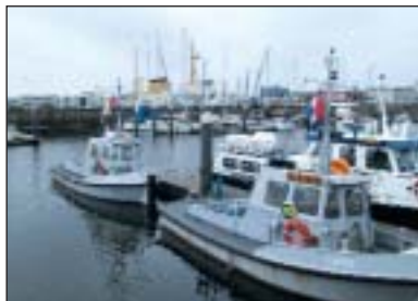
▲ Havenzicht in Den Helder.

De huidige stad, die vanaf 1781 groeide rond de toen gestichte marinebasis, had zwaar te leiden van de Tweede We-