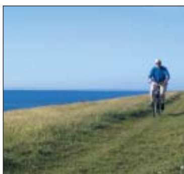
▲ Fietsen op de dijk.

In de huidige haven liggen vooral bevoorradingschepen voor de boorplat-