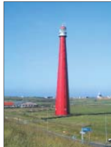
▲ De zestienkantige metalen vuurtoren Lange Jaap.

Enkele jaren geleden braken de Helderse politici zich het hoofd over wat te doen met het enorme complex van de Oude Rijks(scheeps)werf Willemsoord. Gelukkig zagen ze de toekomst helder en vonden ze een geschikte partner in Libéma, dat diverse Nederlandse attractieparken beheert. Zo kon dit voorjaar Cape Holland geopend worden. Aan de naam te