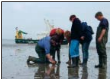
▲ Op robbentocht.

Langs de kust vormen communicatie- en vuurtorens herkenningstekens. Dat geldt in het bijzonder voor de Lange Jaap, met zijn 63,75 m de hoogste vuur-