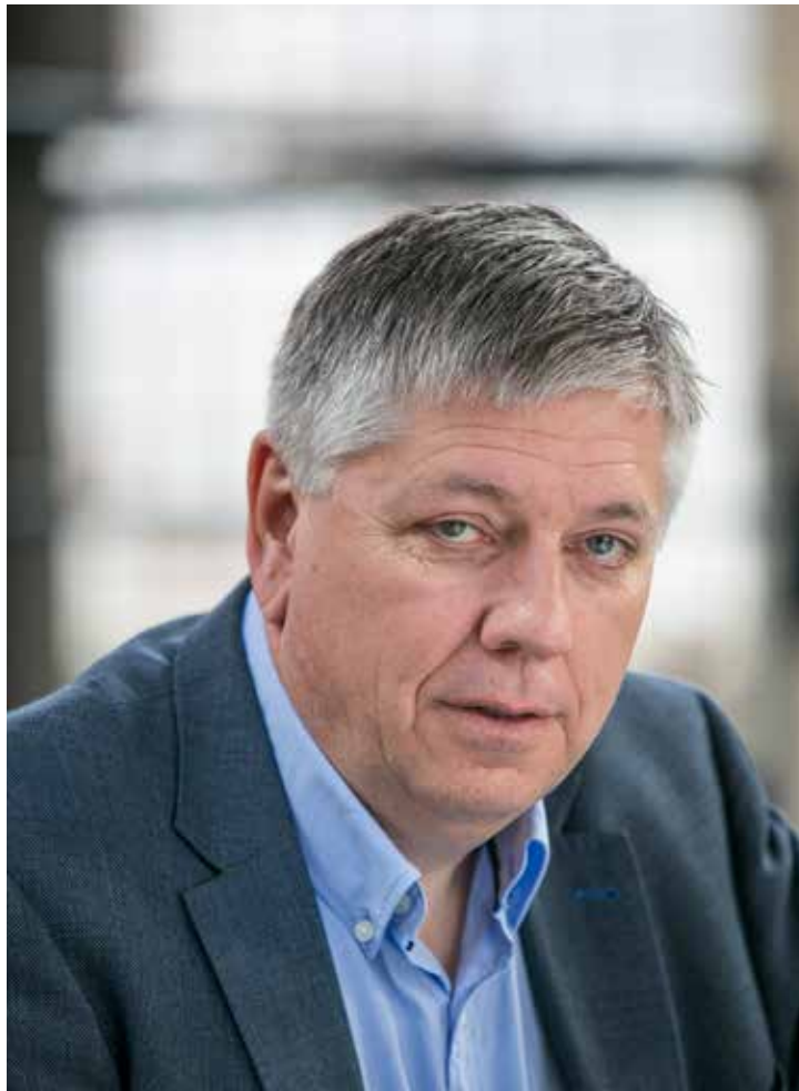
Jo Vandeurzen (59 jaar) Master in de rechten Belgisch minister van Justitie (2007-2008) Vlaams minister van Welzijn, Volksgezondheid en Gezin sinds 2009

In 2014 nam Vlaanderen de bevoegdheid over de dagprijs in woonzorgcentra over van de federale regering. Sindsdien zijn de regelgeving en controles op verhogingen van de dagprijs explicieter gesteld. Op vraag van het agentschap Zorg en Gezondheid hebben het Onderzoeksinstituut voor Arbeid en Samenleving en het Leuvens Instituut voor Gezondheidsbeleid van de KU Leuven het Vlaamse prijsmonitoring- en prijscontrolesysteem geëvalueerd.